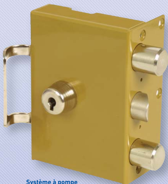
Système à pompe