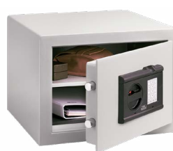
C 1 E FS