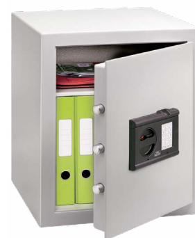
C 4 E FS