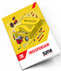
Les outils Indispensables SAM 2020