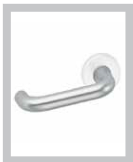
Ergonomie, conforme aux exigences de la norme NF EN 179 (pour ensembles sur plaque et ensembles solidarisés sur rosace 6420)