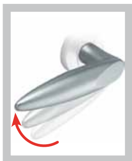
Ressort de rappel